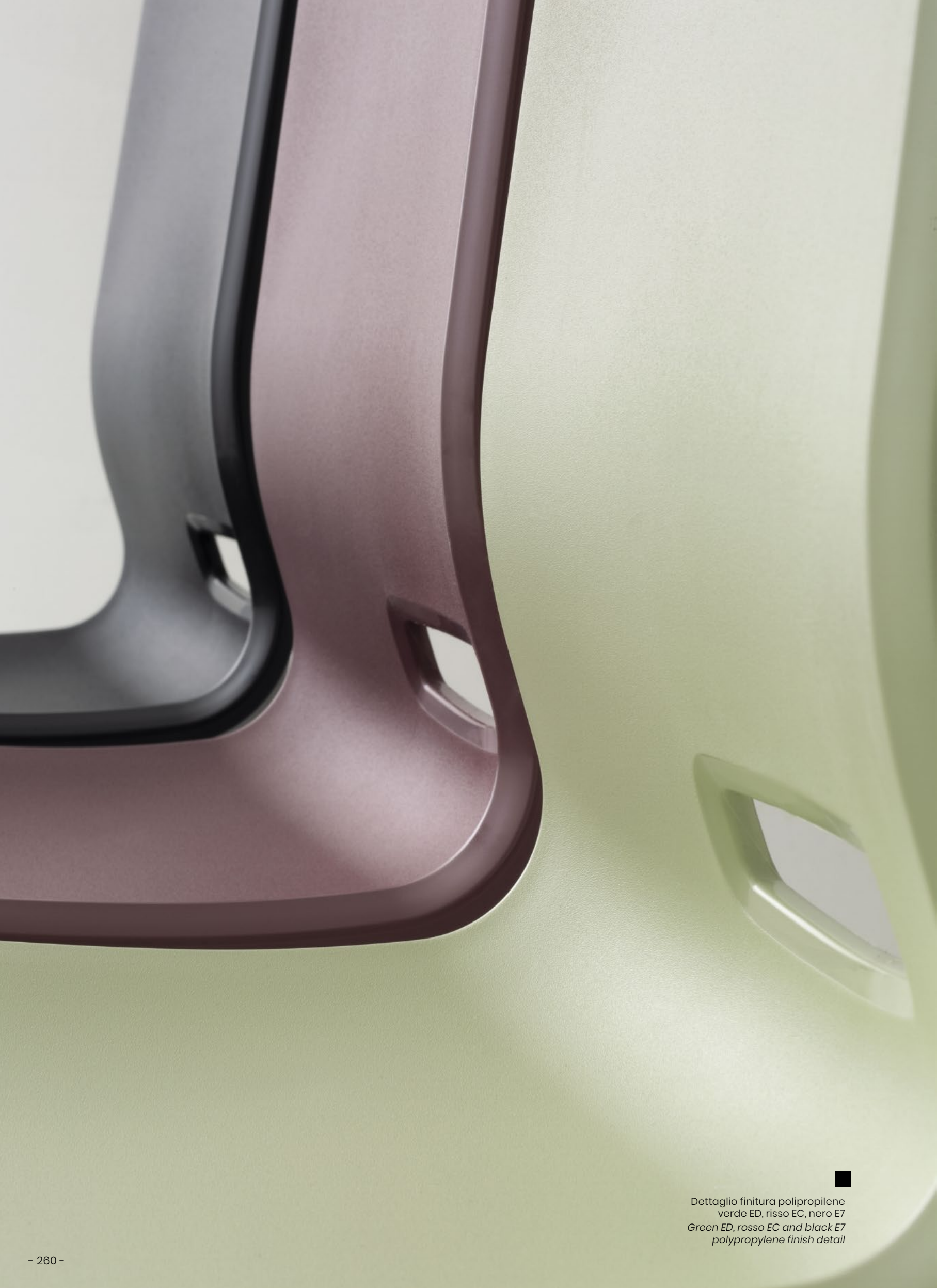
■ Dettaglio finitura polipropilene verde ED, rosso EC, nero E7 Green ED, rosso EC and black E7 polypropylene finish detail